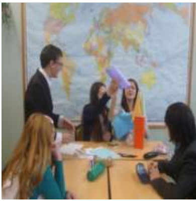
Урок-мастерская (История, 11 класс)