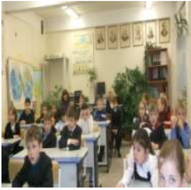
«Химическая игра, 2кл.»