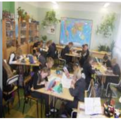
Урок истории и культуры СПб